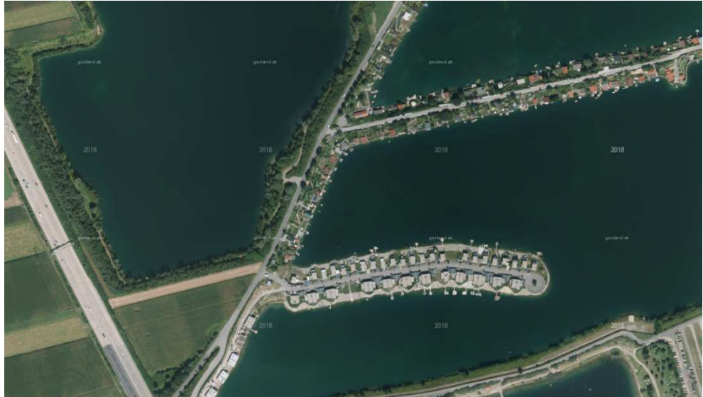
Abb. 9: Seengebiet (Quelle: basemap)

Diese Gebiete sind durch die Zweitwohnsitznutzung geprägt und konzentrieren sich auf die Uferbereiche der ehemaligen Schotterteiche im Nordosten der Gemeinde. Aufgrund der Nähe zum Ballungsraum Graz und der landschaftsräumlichen Besonderheit handelt es sich um eine Nutzung mit hoher Nachfrage bei gleichzeitig geringer Flächenverfügbarkeit.