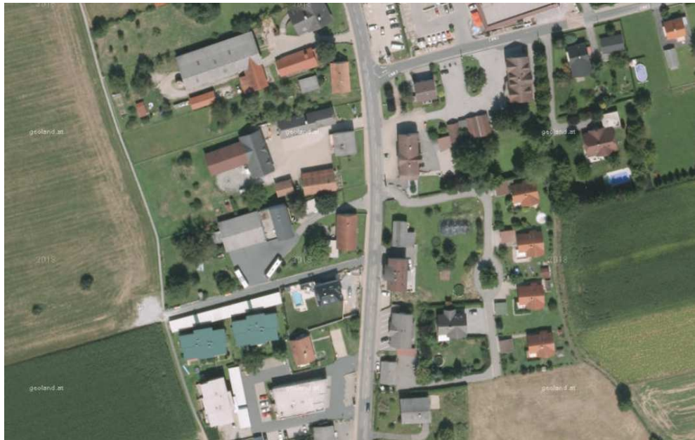
Abb. 1: Hauptstraße Oberpremstätten

Dabei handelt es sich um die historischen Straßendörfer mittelalterlichen Ursprungs (Abgrenzung im Leitbildplan u.a. auf Grundlage der im Franziszeischen Kataster dokumentierten Bebauungsstruktur des frühen 19. Jahrhunderts). Diese sind heute vielfältig genutzt und weisen mitunter ein ungeordnetes Erscheinungsbild auf, das die ursprüngliche Struktur (offene Bauungsweise, Rhythmus aus giebel- und traufständiger Bebauung, grüne Vorgärten, Bauflucht etc.) verunklart. Die alte Bausubstanz ist zum Teil vernachlässigt, die Parzellenstruktur und das Straßennetz sind oft erkennbar verändert.