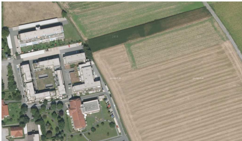
Abb. 5: „Zentralraum“ am Laabach

Geschoßwohnbauten sind im Gemeindegebiet bislang nur in geringer Zahl vorhanden, werden von Bauwerbern aber vermehrt geplant. Da diese Bauten zu gravierenden Störungen des gewachsenen Ortsgefüges führen können, sind im Leitbildplan nur wenige Bereiche für deren Errichtung vorgesehen. Verhindert werden soll eine Überformung des kleinteiligen Bestandes, weshalb als größtes Potential für Geschoßwohnbauten der Bereich des „Zentralraums“ zwischen Laabach und Mitterstraße ausgewiesen wird – hier kann ein neuer Ortsteil und -rand ausgebildet werden, ohne die Qualität der historisch gewachsenen Bestände zu mindern.