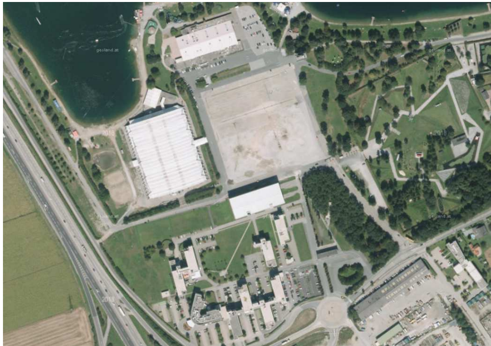
Abb. 7: Schwarzl Freizeitzentrum und IBC

Dabei handelt es sich vordergründig um das Areal des Schwarzl Freizeitentrums inkl. des International Business Center östlich der Hauptsiedlungsbereiche von Premstätten. Im Ortsgebiet bestehen zudem Gebiete mit kommerziellen Einrichtungen des Einzelhandels, Dienstleistungsbetrieben und Büroflächen in ein- bis mehrgeschoßigen großvolumigen Bauanlagen mit zumeist hoch versiegelten Außenräumen.