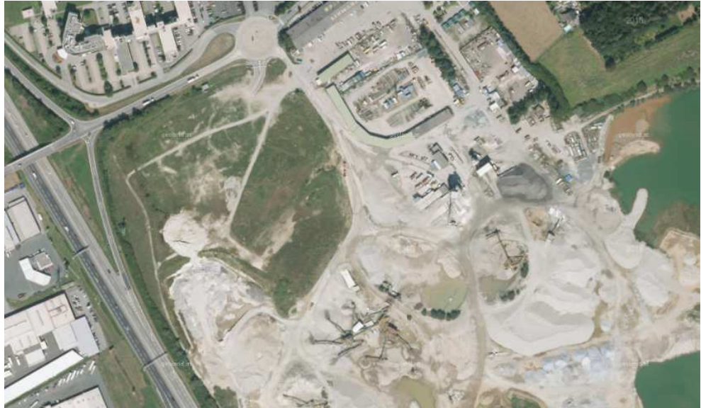
Abb. 10: Entwicklungsgebiet Schottergrube Thalerhofstraße (Porr)

Diese Gebiete stellen die mittel- bis langfristigen Entwicklungspotentiale dar. Sie bestehen aus unbebauten, bereits als Bauland (zumeist in Form von Anschließungsgebieten) festgelegten Flächen, sowie aus Flächen, die im Örtlichen Entwicklungsplan als Potentialflächen noch ohne Baulandfestlegung ausgewiesen sind. Weiters zählen Konversionsflächen zu dieser Kategorie.