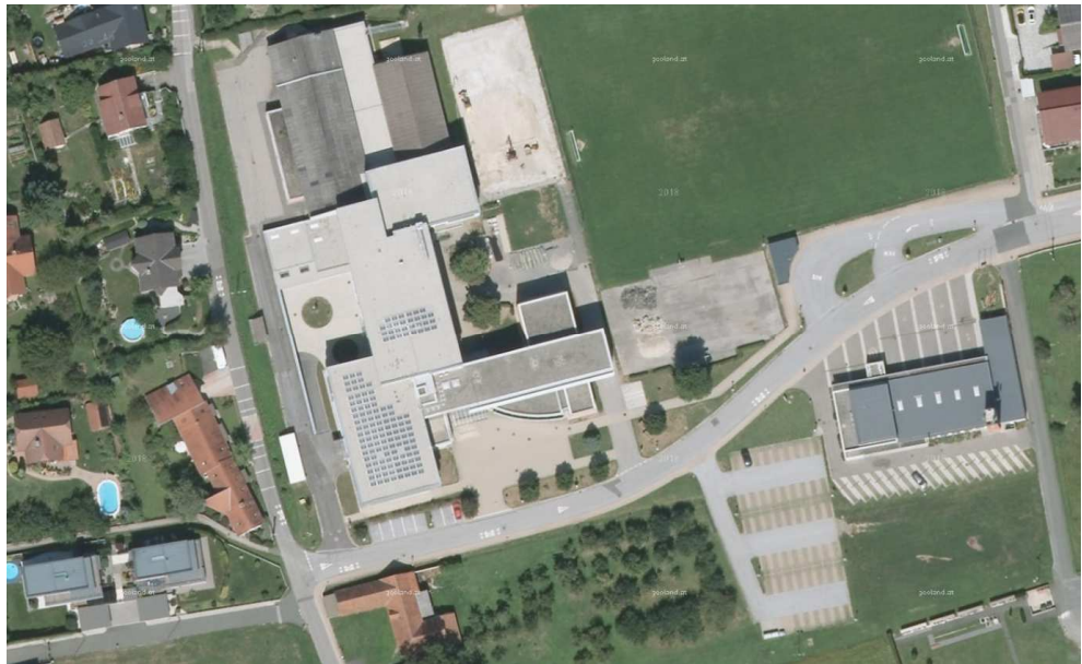
Abb. 6: Schulstandort Unterpremstätten (Quelle: basemap)

Sie haben meist einen hohen Anteil an öffentlich zugänglichen Räumen und sind durch Funktion und qualitätvolle Gestaltung der Außenräume städtebauliche Merkzeichen und Orientierungspunkte.