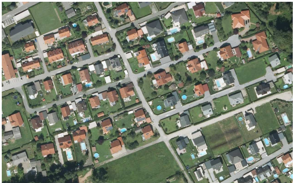
Abb. 3: Wohngebiet Bierbaum West

Diese Bereiche sind im Bestand häufig durch geringe bauliche Ausnutzung geprägt und deshalb in einigen Fällen Zielgebiete der Nachverdichtung. Die meisten dieser Gebiete befinden sich zurückversetzt von den Hauptverkehrsadern sowie in Streusiedlungslagen außerhalb der Siedlungsschwerpunkte. Im geeigneten Gelände ergeben sich mitunter hohe Sichtexpositionen und damit eine hohe visuelle Sensibilität im Landschaftsraum.