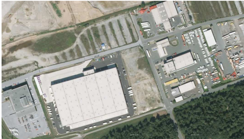
Abb. 8: Betriebsgelände am Sternweg

Dabei handelt es sich um Betriebsgebiete für Produktion, Logistik, Verwaltung undgl. mit vorwiegend Hallenbauten, Lager- und Manipulationsflächen sowie Verwaltungs- und Sozialbauten. Die Gebäude verfügen in der Regel über ein bis zwei (oft überhöhte) Geschoße und stellen zumeist großvolumige Bauanlagen mit hoch versiegelten Außenräumen und oftmals speziellen Nutzungsanforderungen dar. Aufgrund der Lage am Autobahn- und Landesstraßenkreuz sowie der Nähe zum Ballungsraum Graz ist Premstätten eine der landesweit bedeutendsten Standortgemeinden für Industrie und Gewerbe.