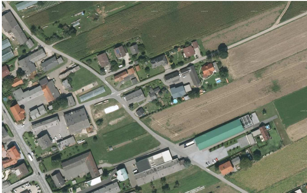
Abb. 2: Alte Dorfstraße Bierbaum

Dabei handelt es sich um Bereiche, die sich im Anschluss an die historischen Straßendörfer entwickelt haben bzw. um Dorfanlagen in denen trotz eingestreuter Einfamilienhausbebauungen udgl. die ursprüngliche Struktur dominiert. Diese Relikte ursprünglich bäuerlicher Struktur sind identitätsstiftend, insbesondere auch in ihrem Zusammenspiel mit der Kulturlandschaft.